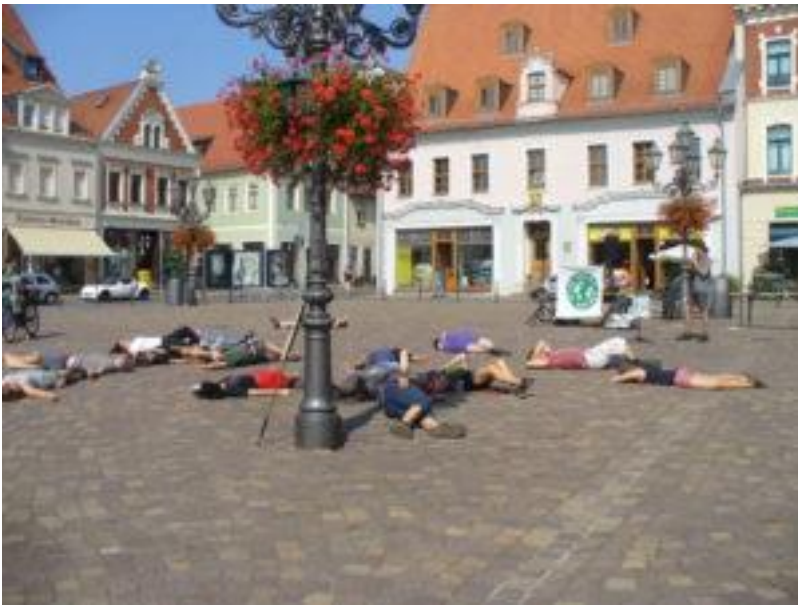
Die-In auf dem Wurzener Markt

Näheres: https://wurzener-land-nachrichten.de/?p=1091